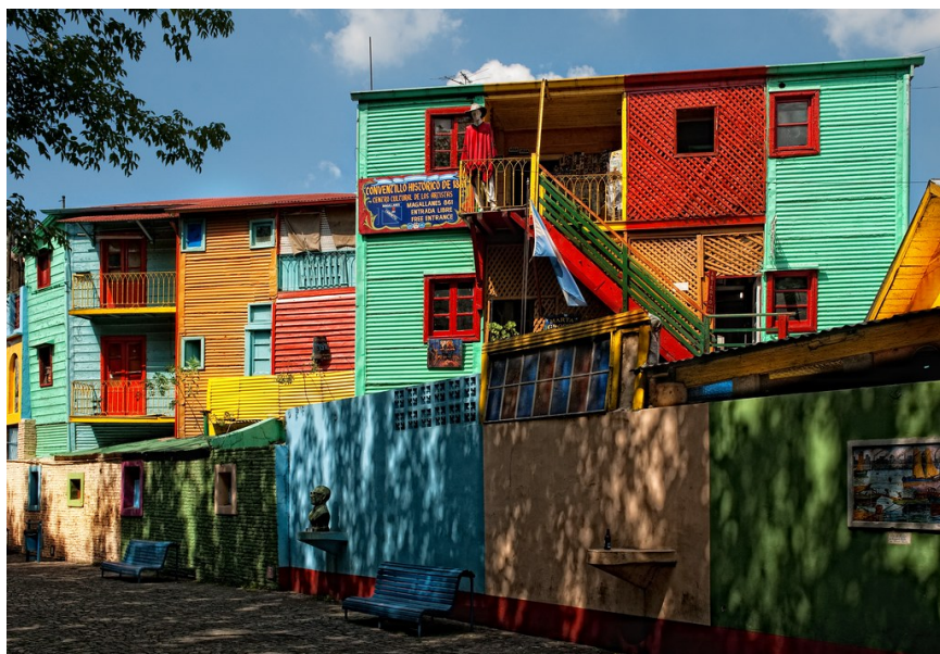
"Una calle en Buenos Aires" por Trey Ratcliff tiene licencia CC BY-NC-SA 2.0