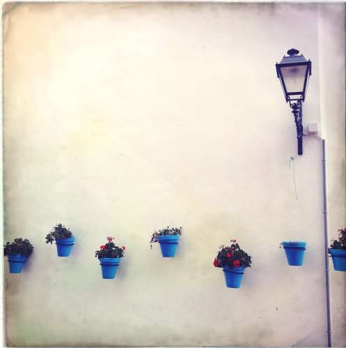
"Pueblo de Mijas, Andalucía" por Nick Kenrick , tiene licencia CC BY 2.0