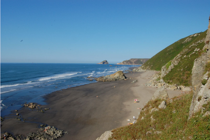
"Playa de los Quebrantos, Asturias" por Christopher C. Oechler tiene licencia CC BY-NC-SA

• I'd go to the beach even if it snowed in summer. → Iría a la playa aunque nevara en verano.