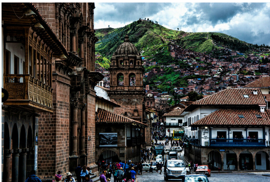
"Calles de Cuzco" por Miradortigre tiene licencia CC BY-NC 2.0

opinión en ningún momento, sin expresar tus gustos y preferencias, sin decir lo que te parece bien o mal. Si el texto es importante, y tienes tiempo, conviene que lo dejes "dormir" un día, pensando en otras cosas, y volverlo a revisar para terminar la versión definitiva. Con frecuencia se descubren fallos y gazapos básicos.