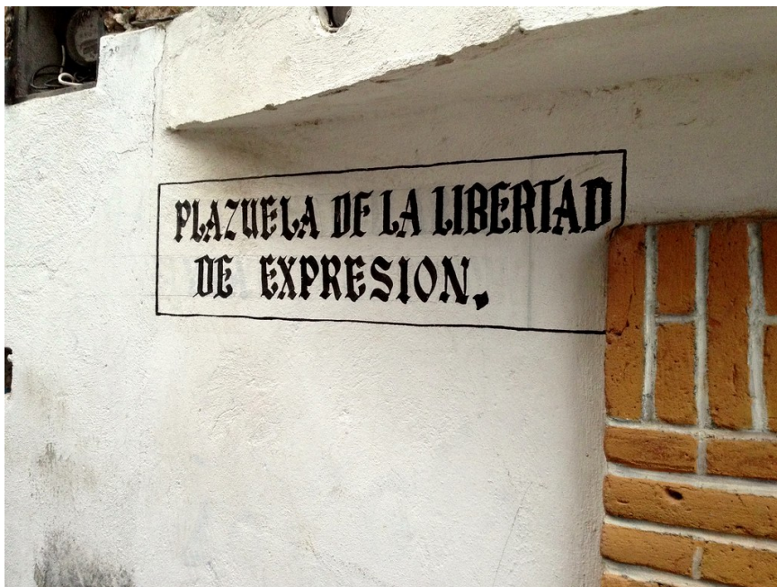
"Plazuela de la libertad de expresion." por vnoel tiene licencia CC BY-NC 2.0

Tanto el tema, la organización y la expresión no son fases sucesivas: hay que tenerlas en cuenta a la vez. En general, al escribir una redacción de cualquier tipo, tendrás que hacer un pequeño esquema o borrador (para organizarte bien y para que no se te olviden detalles), y luego revisarlo para quitar lo que no te guste, y enriquecerlo con otros detalles. Cuando hayas terminado, vuelve a revisar todo por si te has dejado algo, o has cometido alguna falta de ortografía o de gramática.