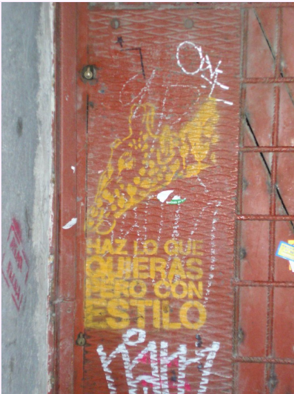
"Haz lo que quieras pero con estilo" por Brocco Lee tiene licencia CC BY-NC-SA 2.0

Cuando no se menciona el antecedente, la cláusula adjetiva se introduce con lo que :