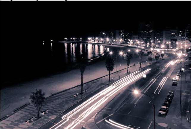
"Montevideo - Rambla por la noche"

• Los próximos capítulos van a explicar diferentes tipos de oraciones en que se emplea el subjuntivo.