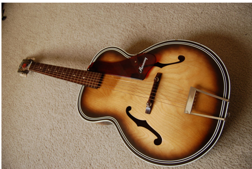
"1966 Harmony" por Christopher C. Oechler tiene licencia CC BY-NC-SA