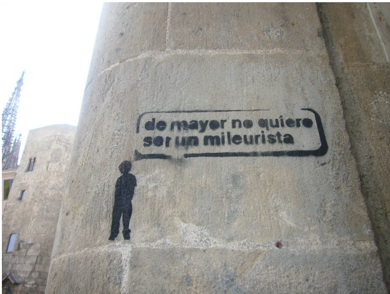
"mileurista-bcn" por Tiscar tiene licencia CC BY-NC-SA 2.0