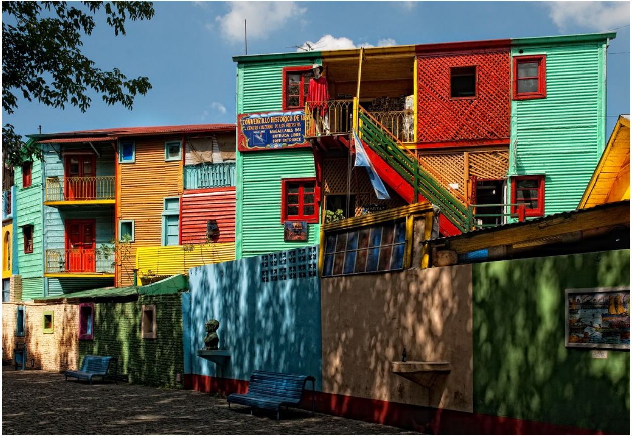
"Una calle en Buenos Aires" por Trey Ratcliff tiene licencia CC BY-NC-SA 2.0