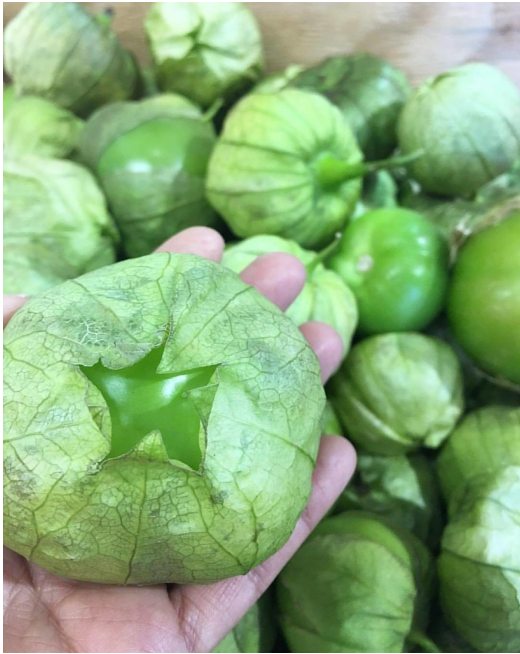
"Tomatillos verdes"

• Hay montañas bonitas . Hay montañas en América que son muy bonitas .