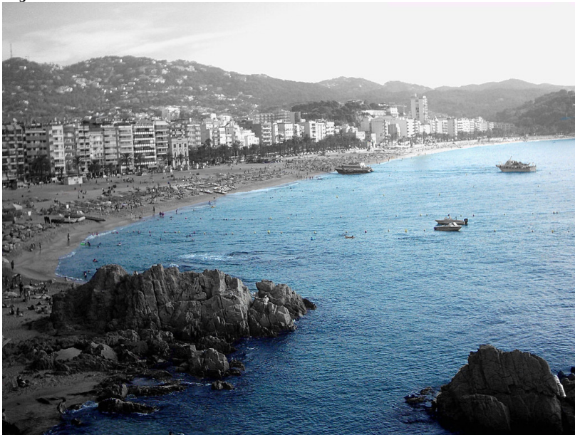
"El mar, la mar" (La Playa de Lloret de Mar) Hay adjetivos que tienen una terminación masculina y otra femenina: