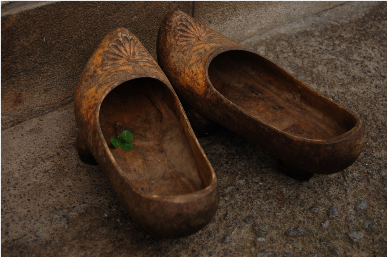
"Madreñas asturianas" por Christopher C. Oechler tiene licencia CC BY-NC-SA

La conjunción si (sin tilde, para diferenciarla del afirmativo sí ) se usa para introducir una condición: