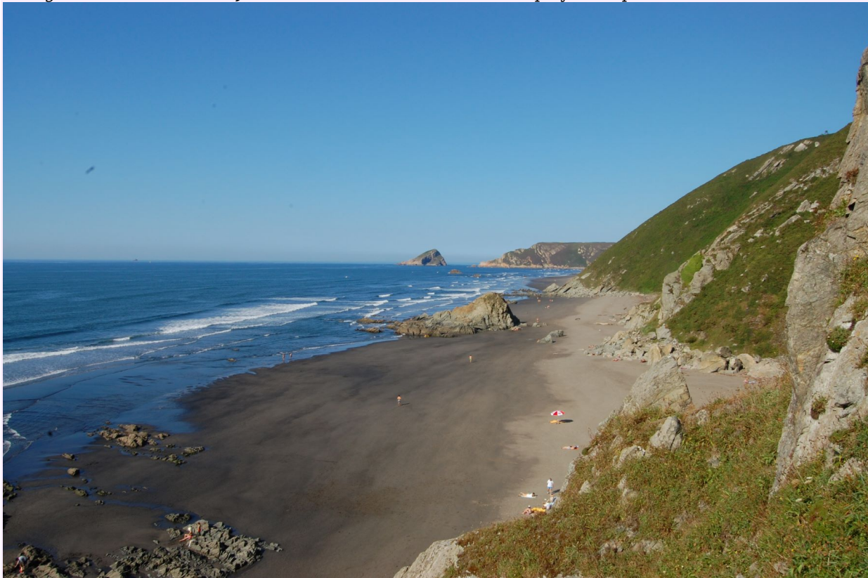
"Playa de los Quebrantos, Asturias" por Christopher C. Oechler tiene licencia CC BY-NC-SA