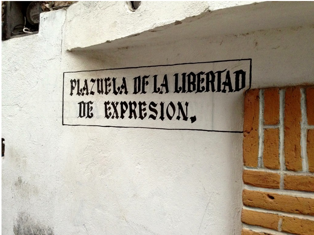
"Plazuela de la libertad de expresion."

Tanto el tema, la organización y la expresión no son fases sucesivas: hay que tenerlas en cuenta a la vez. En general, al escribir una redacción de cualquier tipo, tendrás que hacer un pequeño esquema o borrador (para organizarte bien y para que no se te olviden detalles), y luego revisarlo para quitar lo que no te guste, y enriquecerlo con otros detalles. Cuando hayas terminado, vuelve a revisar todo por si te has dejado algo, o has cometido alguna falta de ortografía o de gramática.