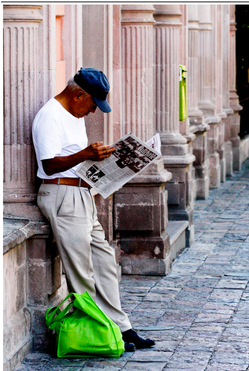
"Hombre leyendo el periódico"

Hay otros puntos que debemos considerar a la hora de redactar un texto periodístico: