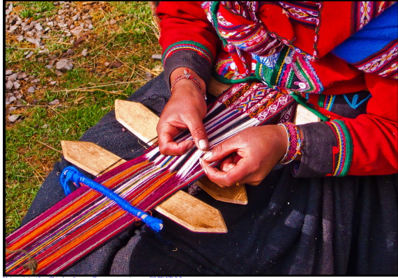
Artisanas tejiendo en Cuzco, Perú

3. Como adjetivo, para expresar el resultado de un proceso o una acción: