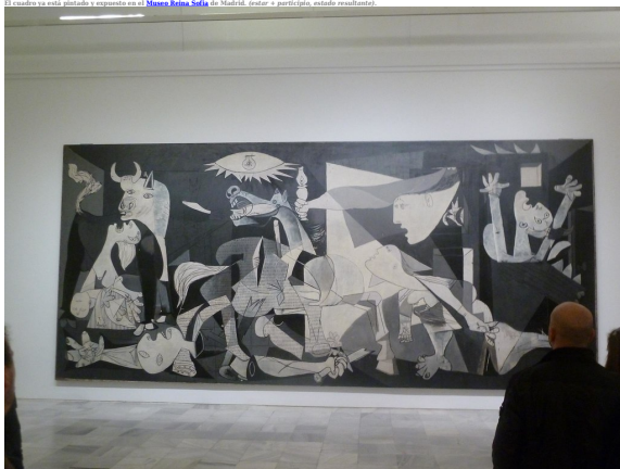
Pintura Guernica (1937) de Pablo Picasso en Museo Reina Sofía de Madrid , por Luisen02 (sin licencia) CC-BY-SA 4.0