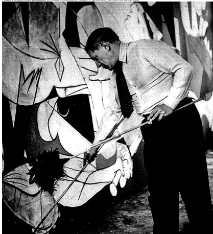
Pablo Picasso pintando el cuadro 'Guernica' (1937) , por Documentación de Pintores (sin licencia) CC-BY-SA 4.0

Nota la diferencia entre el gerundio con estar y el participio con estar :