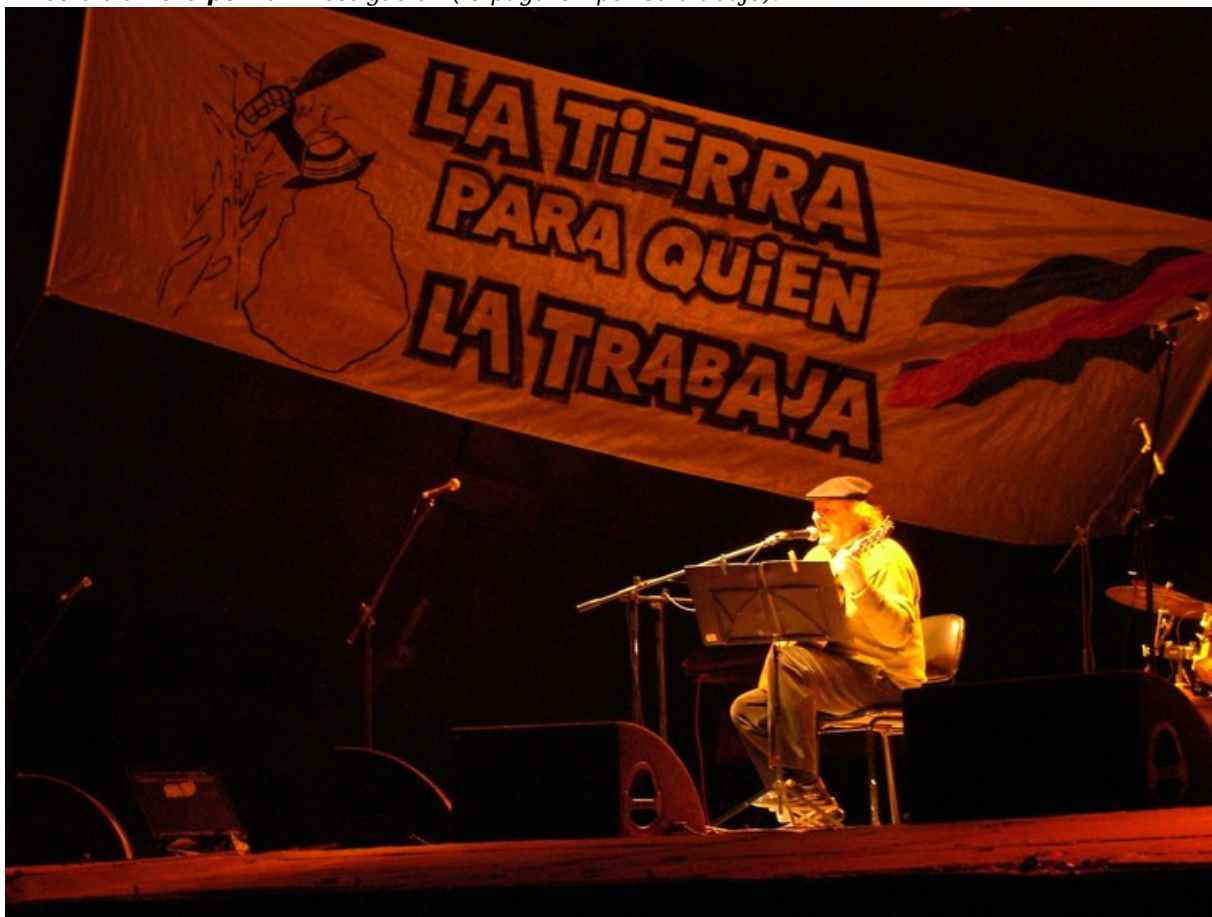
"Daniel Viglietti - La tierra para quien la trabaja" por libertinus tiene licencia CC BY-SA 2.0 "globos por la Paz" por kinojam tiene licencia CC BY-NC-SA 2.0