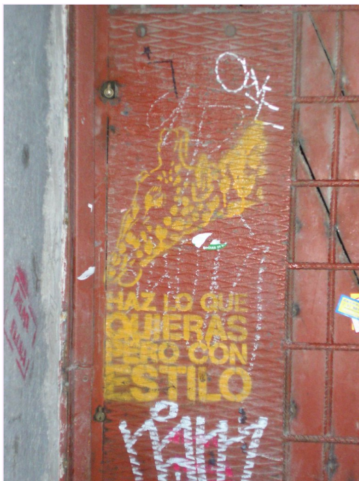
"Haz lo que quieras pero con estilo"

Cuando no se menciona el antecedente, la cláusula adjetiva se introduce con lo que :