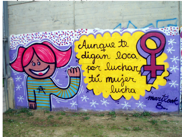
Aunque te digan loca por luchar... , por Pascida tiene licencia CC BY-NC-SA 4.0