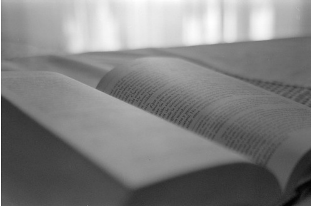
"Libro abierto"

En un cuento o novela, normalmente las descripciones se encuentran asociadas a partes narrativas y dialogadas; pero las descripciones no se encuentran, evidentemente, solo en la literatura: en la vida diaria recurrimos a ellas cuando tenemos que explicar cómo es una persona, un objeto o un lugar.