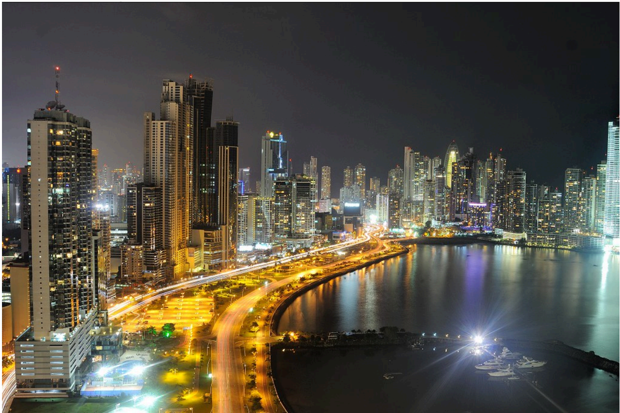
"Ciudad de Panamá - Skyline de noche" por thibhou tiene licencia CC BY-NC-ND 2.0

EXPOSICIÓN ESCRITA Los textos escritos también pueden incluir gráficos, diagramas y mapas conceptuales; las imágenes que incluyas deben estar siempre relacionadas con el texto.