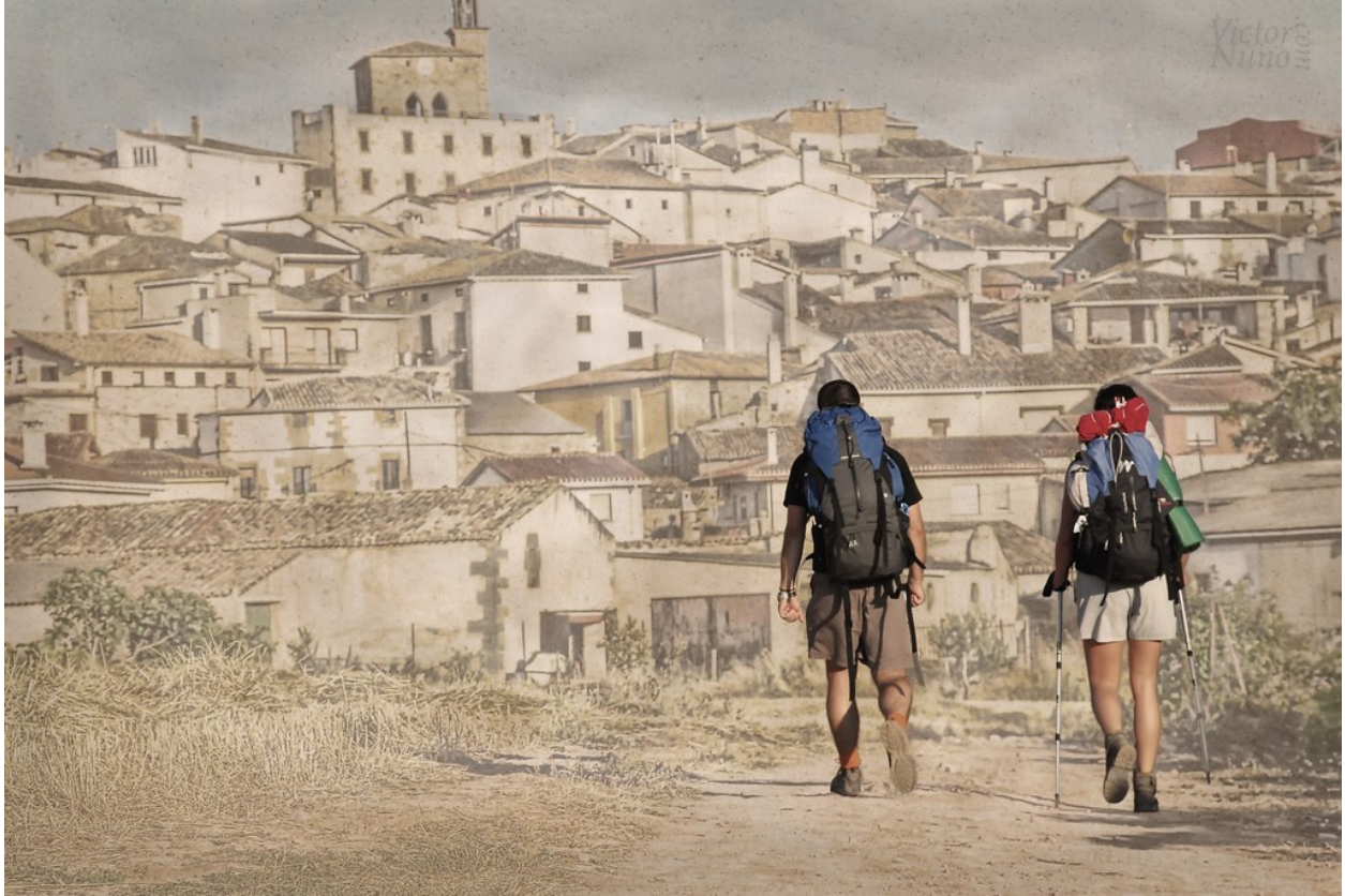
"El cuento de la vida"