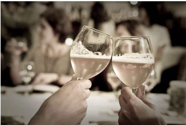
"Les Nits del Zarautz - 13 de octubre de 2011" por JolinesPro tiene licencia CC BY-NC-SA 2.0