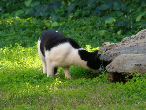
"Gato con olfato"

Con el olfato se distinguen y se perciben los olores.