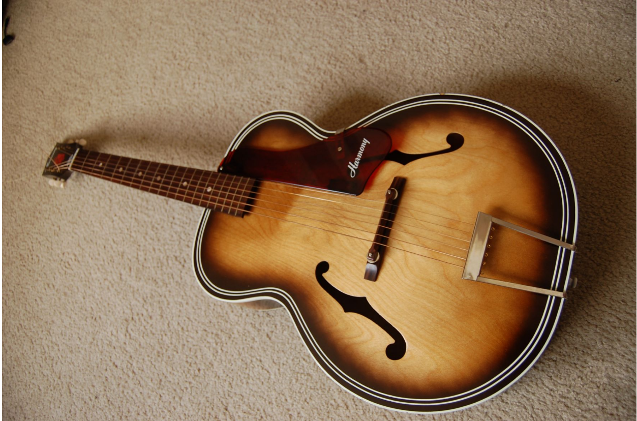
"1966 Harmony" por Christopher C. Oechler tiene licencia CC BY-NC-SA